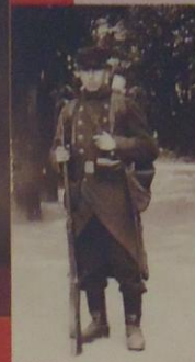
PIOU-PIOU EN UNIFORME. SURNOM DONNÉ AUX SOLDATS FRANÇAIS EN 1914.

Commandant en chef des armées du Nord et du Nord-Est en 1914, il remporte la victoire décisive de la Marne. Il est nommé commandant en chef des armées françaises en décembre 1915. Après l'échec de sa stratégie d'offensives à outrance, en 1915, puis l'échec de la bataille de la Somme, il est remplacé par le général Nivelle en décembre 1916. Il est fait maréchal de France la même année.