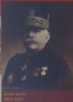
JOSEPH JOFFRE 1852-1931

Commandant en chef des armées du Nord et du Nord-Est en 1914, il remporte la victoire décisive de la Marne. Il est nommé commandant en chef des armées françaises en décembre 1915. Après l'échec de sa stratégie d'offensives à outrance, en 1915, puis l'échec de la bataille de la Somme, il est remplacé par le général Nivelle en décembre 1916. Il est fait maréchal de France la même année.