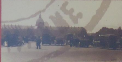
LE 7 SEPTEMBRE, 5 BATAILLONS, SOUS 6 000 HOMMES SONT ACHÉMINÉS SUR LE FRONT GRÂCE AUX VÉHICULES PARTICULIERS ET AUX TAXIS RÉQUISITIONNÉS PAR LE GÉNÉRAL GALLIENI, GOUVERNEUR MILITAIRE DE PARIS.