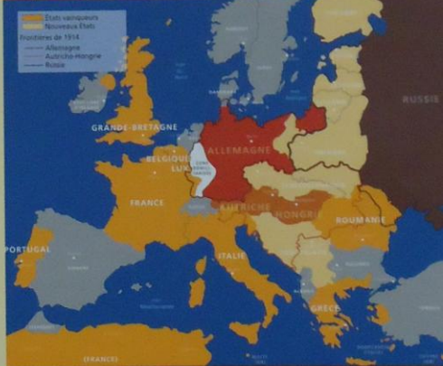
➔ L'EUROPE APRÈS LA GUERRE

La France est particulièrement éprouvée sur son territoire. 1,4 millions de soldats sont morts ou disparus, 4,2 millions sont blessés, plus de 500 000 prisonniers rentrent chez eux. Ce bilan humain est aggravé par les ravages de la grippe espagnole qui sévit de 1918 à 1919. Le Nord-Est de la France, riche région agricole et industrielle d'avant-guerre, est totalement détruit. Le pays est lourdement endetté auprès des États-Unis, devenus les créanciers du monde.