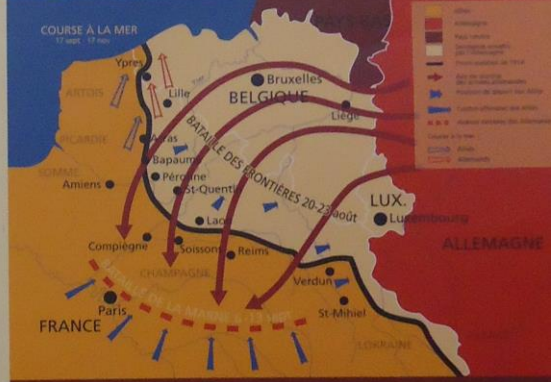
LE FRONT OUEST EN 1914

Chacun des adversaires tente alors de contourner l'ennemi par le Nord. La « course à la mer » aboutit à la fin de 1914 à la constitution d'un front continu des Vosges à la mer du Nord, sur plus de 800 km. À l'Est, les Russes ont réussi à surprendre les Austro-Allemands avant d'être arrêtés à Tannenberg, le 31 août.