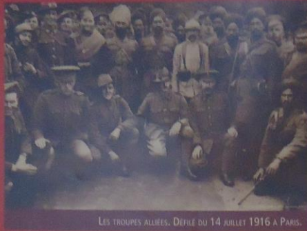
LES TROUPES ALLIÉES. DÉFILÉ DU 14 JUILLET 1918 À PARIS.