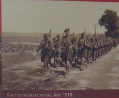
DÉFILÉ DE TROUPES ÉCOSSAISES. AOÛT 1918.