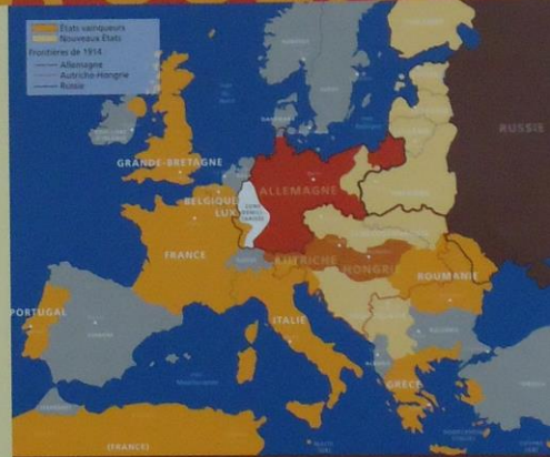
L'EUROPE APRÈS LA GUERRE

La France est particulièrement éprouvée sur son territoire. 1,4 millions de soldats sont morts ou disparus, 4,2 millions sont blessés, plus de 500 000 prisonniers rentrent chez eux. Ce bilan humain est aggravé par les ravages de la grippe espagnole qui sévit de 1918 à 1919. Le Nord-Est de la France, riche région agricole et industrielle d'avant-guerre, est totalement détruit. Le pays est lourdement endetté auprès des États-Unis, devenus les créanciers du monde.