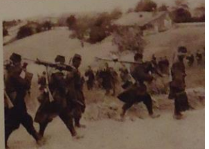
TROUPES FRANÇAISES EN MOUVEMENT PENDANT LA BATAILLE DE LA MARNE.