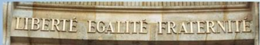
Devise, couleurs du drapeau ou visage de Marianne se retrouvent sur tous les édifices ou supports de communication de l'État.

Si elle est une garantie accordée à tous dans notre pays, elle impose également des responsabilités. C'est un droit qui n'est jamais acquis définitivement mais au contraire préservé par son utilisation régulière et respectueuse des autres.