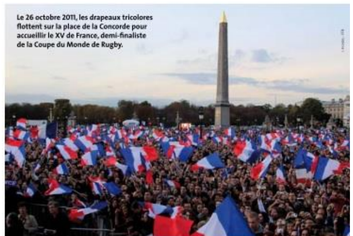
Le 26 octobre 2011, les drapeaux tricolores flottent sur la place de la Concorde pour accueillir le XV de France, demi-finaliste de la Coupe du Monde de Rugby.

Les trois couleurs réunies sont des symboles d'unité et de concorde. La fête de la Fédération, le 14 juillet 1790, a consacré ce drapeau comme emblème de la Nation. Depuis 1830, il devient, sans interruption, le drapeau national.