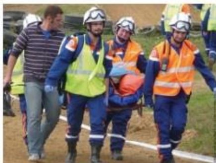
Intervention de la protection civile lors de la tempête Xynthia en février 2010 (Loire-Atlantique).

Pompiers, secouristes risquent leur vie pour aider la population dans les accidents de la route ou de la vie quotidienne et dans les situations de crise.