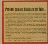
Recto d'un tract du mouvement Combat, 1943. ser 1000