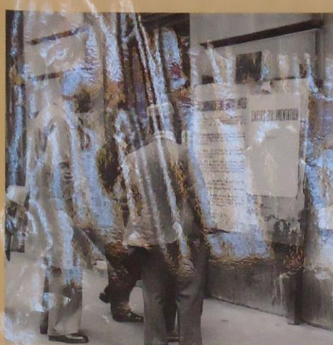
Passants consultant des affiches administratives annonçant l'apparition des cartes d'alimentation, Paris, août 1940. ser 1000