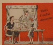
Dépliant de la France combattante, 1943. ser 1000