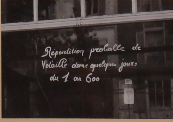
Reposition probable de Volaille dans quelques jours du 1 au 600 ser 1000