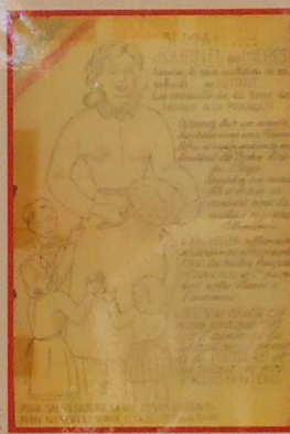
Tract illustré de la Résistance dénonçant le pillage de la France, 1942. ser 1000