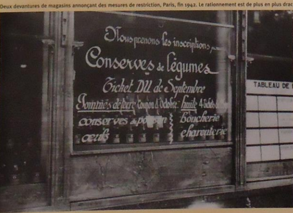
Deux devantures de magasins annonçant des mesures de restriction, Paris, fin 1942. Le rationnement est de plus en plus draconien et de nombreux produits disparaissent de la vente. ser 1000