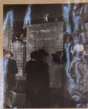
Plancheau informant de l'état du rationnement, Paris, juin 1942. ser 1000