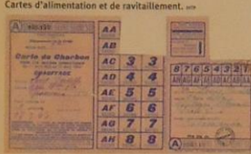
Cartes d'alimentation et de ravitaillement. ser 1000