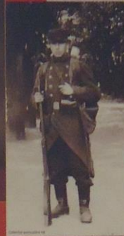
PIOU-PIOU EN UNIFORME. SURNOM DONNÉ AUX SOLDATS FRANÇAIS EN 1914.

Commandant en chef des armées du Nord et du Nord-Est en 1914, il remporte la victoire décisive de la Marne. Il est nommé commandant en chef des armées françaises en décembre 1915. Après l'échec de sa stratégie d'offensives à l'ouest, en 1915, puis l'échec de la bataille de la Somme, il est remplacé par le général Nivelle en décembre 1916. Il est fait maréchal de France la même année.