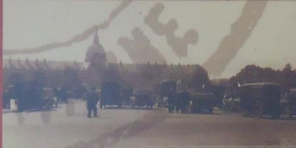
Le 7 septembre, 5 bataillons, soit 6 000 hommes sont acheminés sur le front grâce aux véhicules particuliers et aux taxis réquisitionnés par le général Gallieni, gouverneur militaire de Paris.