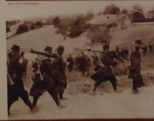
TROUPES FRANÇAISES EN MOUVEMENT PENDANT LA BATAILLE DE LA MARNE.