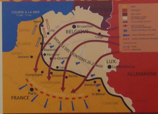
LE FRONT OUEST EN 1914

Chacun des adversaires tente alors de contourner l'ennemi par le Nord. La « course à la mer » aboutit à la fin de 1914 à la constitution d'un front continu des Vosges à la mer du Nord, sur plus de 800 km. À l'Est, les Russes ont réussi à surprendre les Austro-Allemands avant d'être arrêtés à Tannenberg, le 31 août.