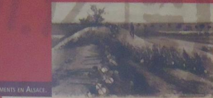
PREMIERS ENGAGEMENTS EN ALSACE.