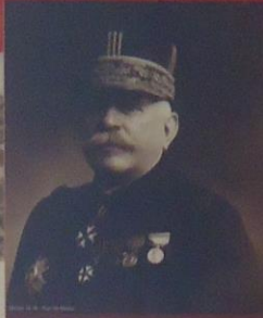
Joseph Joffre 1852-1931

Commandant en chef des armées du Nord et du Nord-Est en 1914, il remporte la victoire décisive de la Marne. Il est nommé commandant en chef des armées françaises en décembre 1915. Après l'échec de sa stratégie d'offensives à l'ouest, en 1915, puis l'échec de la bataille de la Somme, il est remplacé par le général Nivelle en décembre 1916. Il est fait maréchal de France la même année.