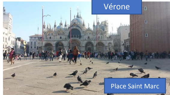
Place Saint Marc

La journée à Venise, sous le soleil, a permis à chacun de découvrir les richesses de la Sérénissime : basilique et place Saint Marc, pont de l'Académie, pont du Rialto, en empruntant de ruelles dont les nombreux petits ponts permettent de franchir les multiples canaux.